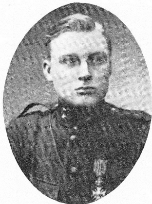
BAILLIU, Adolphe , né le 26 août 1890, à Gand. Capitaine du Génie (Aérostation), Croix G.; Méd. camp. Afrique, 2 citations. Officier de valeur, se distingua par sa bravoure aux opérations autour d'Anvers. Parti pour la colonie, contracta les gripes infectieuses et mourut à Likasi (Haut-Katsanga), le 22 novembre 1918.