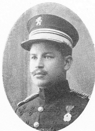
VAN DAMME, Pierre , né le 27 novembre 1887, à Gand. Capitaine, 1 er régiment armée coloniale. Chev. Ord. Cour.; Cr. de G.; 3 citations. Officier d'une grande bravoure, trouva la mort des braves, frappé d'une balle en pleine poitrine, au combat de Saïdi-Mahengé, le 24 octobre 1917.