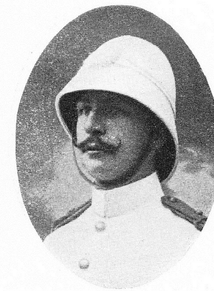
GRÉGOIRE, Germain , né le 8 février 1886, à Marcinelles. Lieutenant. Etoile de Service. Officier d'une grande endurance, s'acquitta vaillamment de missions délicates qui lui furent confiées. Terrassé par le climat, mourut à Basankusu, le 7 février 1915.