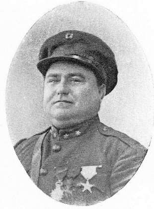
POIGNARD, Fernand , né le 29 juin 1886, à Mons. Capitaine en second. O. Léop.; Chev. O. Cour.; C. G.; Méd. Com. Camp. Afrique. Brillant officier, d'une bravoure exemplaire, s'acquitta de nombreuses missions au cours de la campagne d'Afrique. Disparut en Méditerranée, le 14 juillet 1918, lors du torpillage du vapeur Djennak.